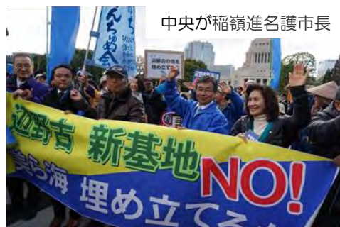
中央が稲嶺進名護市長