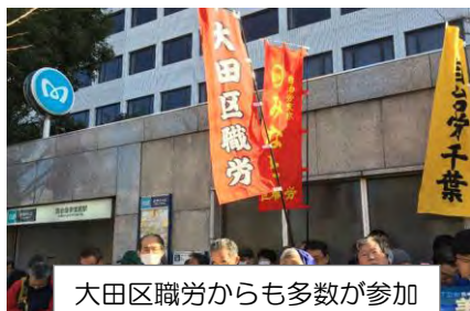
大田区職労からも多数が参加