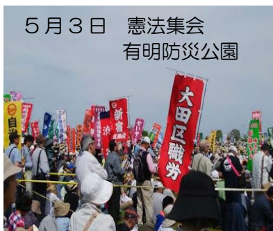
5月3日 憲法集会 有明防災公園